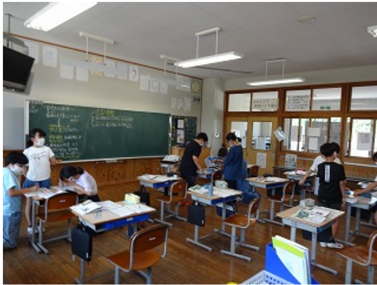
つばさ・ひかり学級