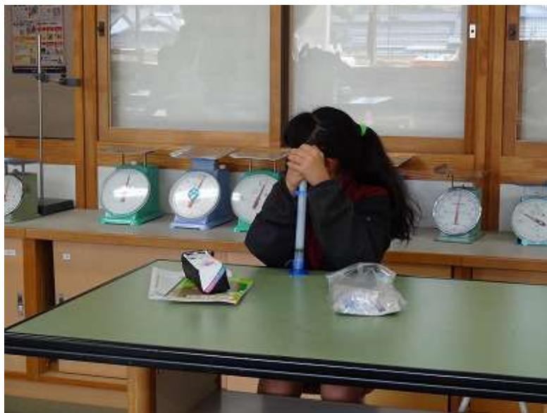
横田小 1年生「図工：クレーン車の絵」