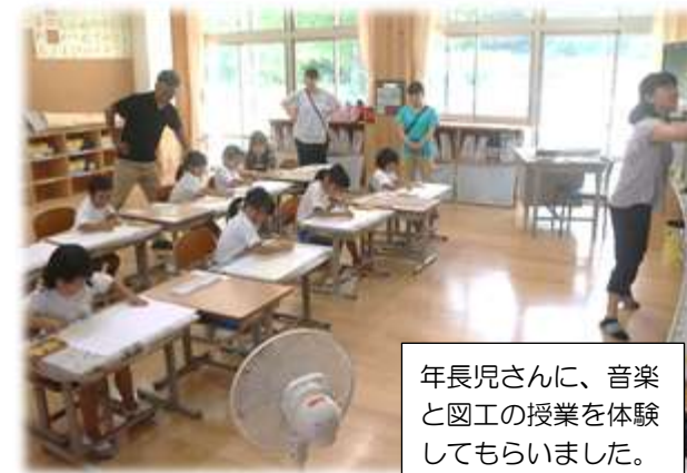
年長児さんに、音楽と図工の授業を体験してもらいました。

こういった問題を未然に防ぐために、小学校としては、子どもたちがスムーズに学校生活をスタートさせることができるよう、受け入れ体制を整えておくことが重要となります。その手立ての一つとして、本校では、あらゆる機会を活用しながら八川幼稚園との連携を深めています。