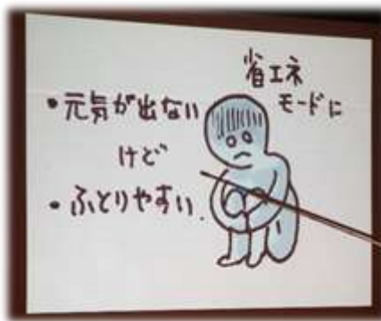
↑ 朝ごはんを食べないと…