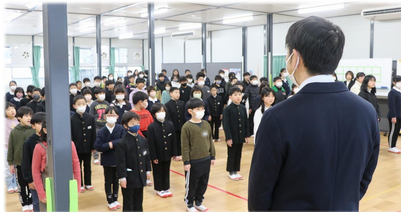
↑ 教頭先生のリードで、元気よく新年のあいさつを交わしました。