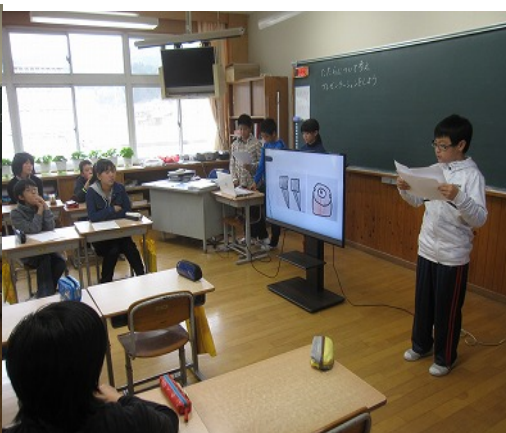
5年生「外国語活動」で道案内をペアでしています。 6年生「たたら」についてプレゼン発表しました。

このようにバラエティに富んだ授業を公開しました。 ご参加いただいた保護者の皆様、ありがとうございました。