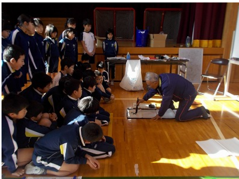
4・5・6年生は、体育館で一緒に練習しました。