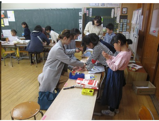
1年生「すきなもののクイズ」を作り、紹介してます。 2年生「おもちゃ教室」親子で夢中ですね。