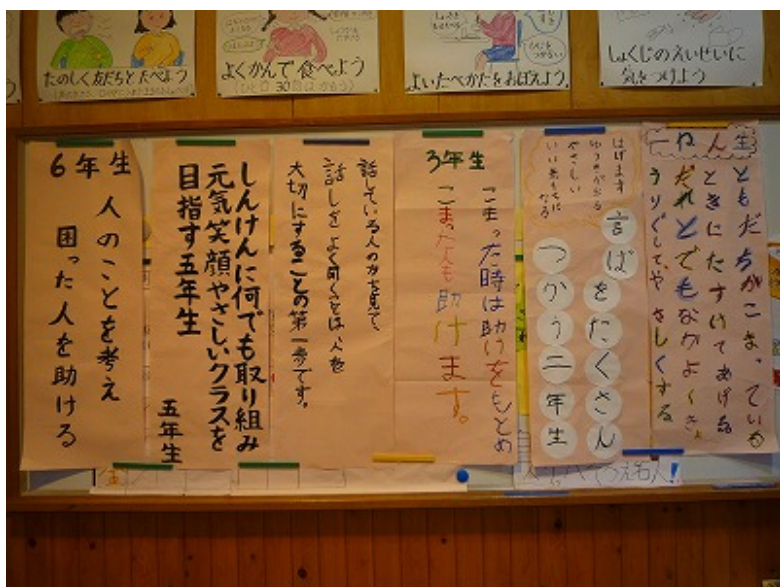
各学年の人権標語です。