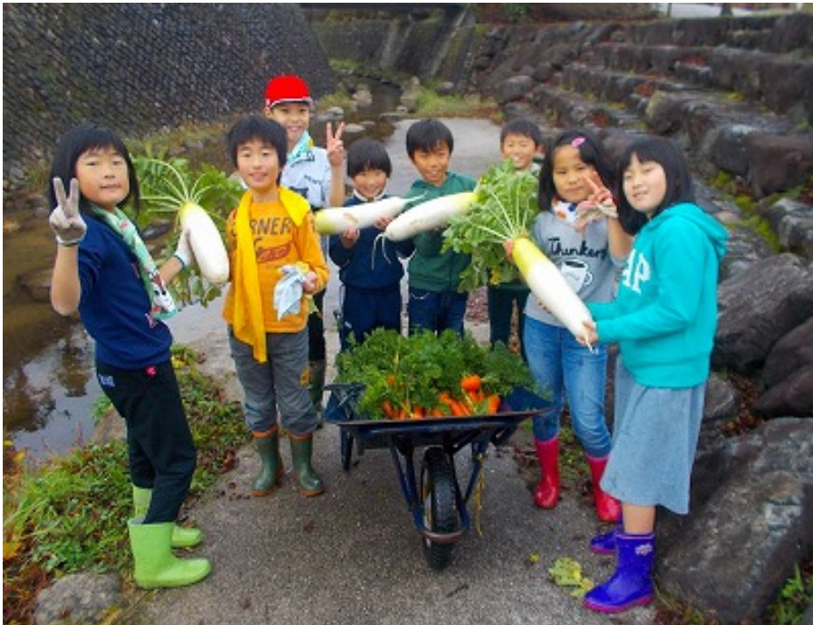
3年生 大きなだいこんを収穫しました。喜びと満足感いっぱい!!