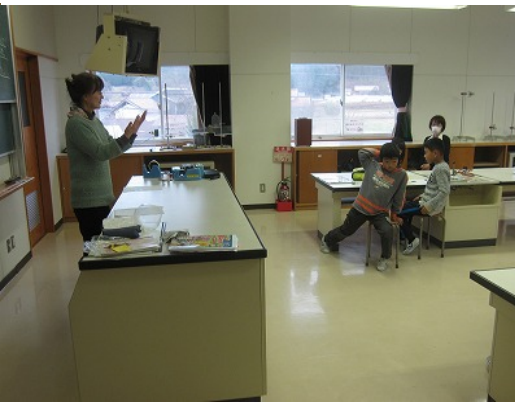
3年生「まほうの音楽」を熱心に制作中です。 4年生理科で「あわの正体」を探りました。