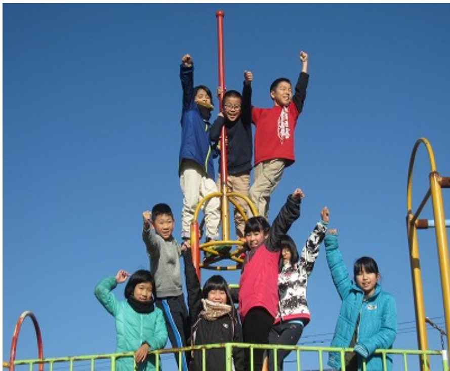
4年生 終業式の日、青空のもと。元気と笑顔満開です!!