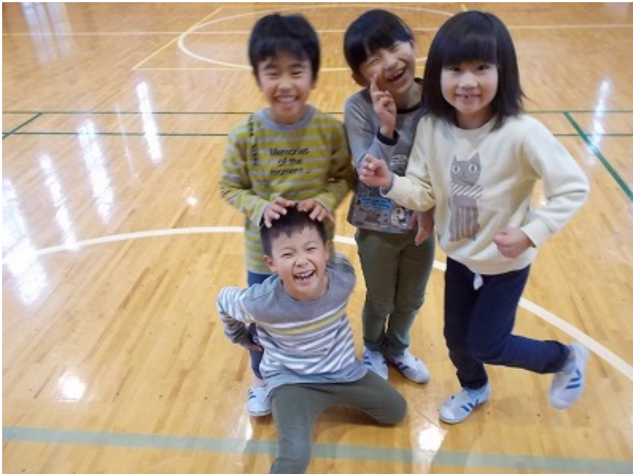
1年生 お楽しみ会を楽しみました。4人のこのはじける笑顔!!

その表情がとても素敵で、是非みなさまに観ていただきたいと思い、年末特集としてお届けします。