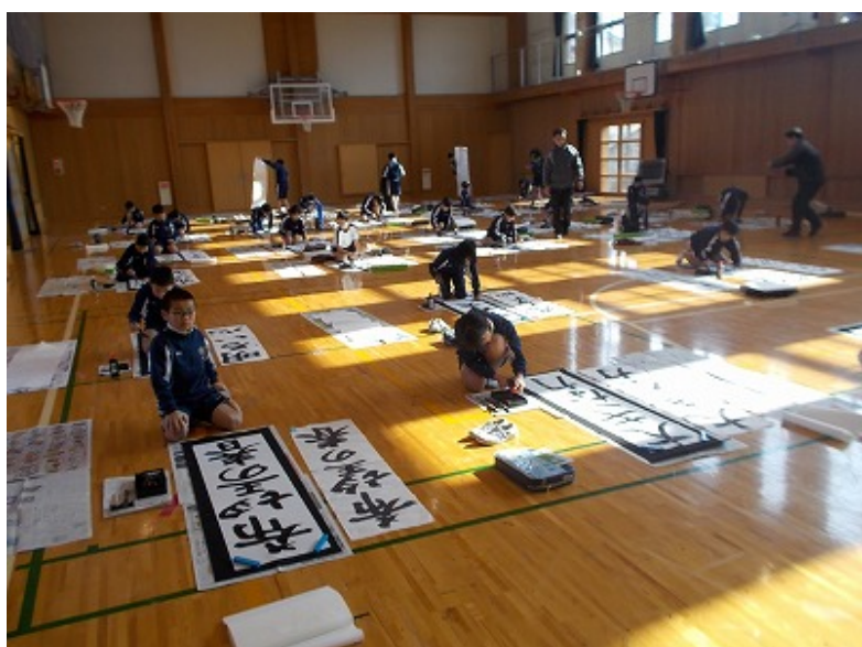
寒さも忘れるくらい、集中して一生懸命書きました。