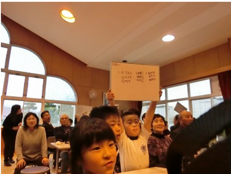
6年生からのクイズもありました。