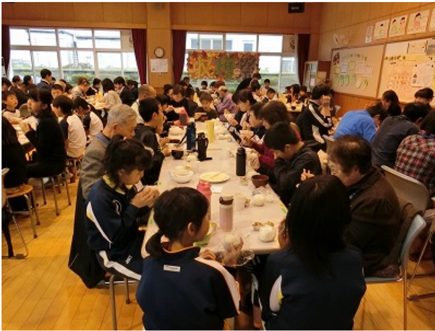
会食の様子です。ご覧のように、たくさんの方にお越しいただき、箸も話も進みました。