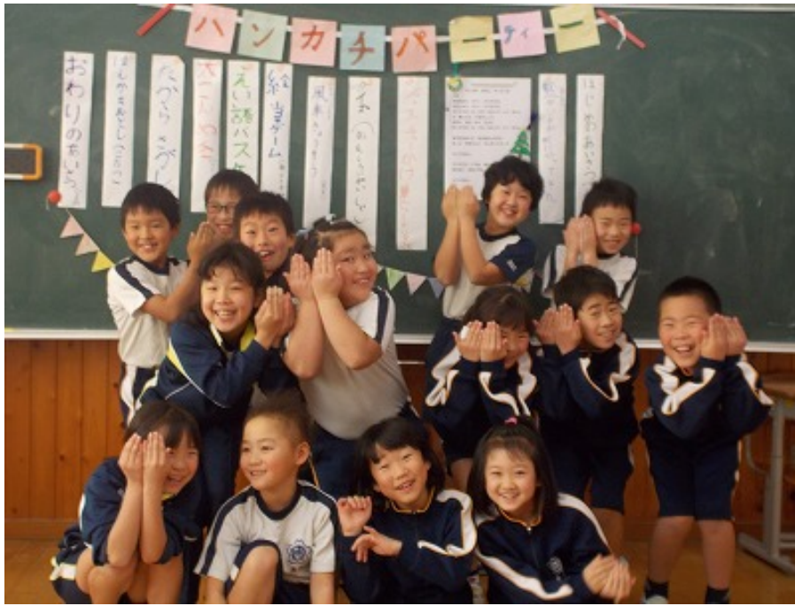
2年生 大ハンカチパーティーです。喜びが飛び出しそうです!!