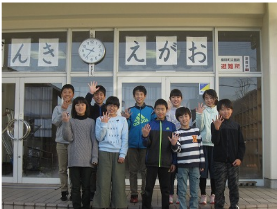
5年生 サムライファイブ。清々しさと余裕のニッコリポーズ!!