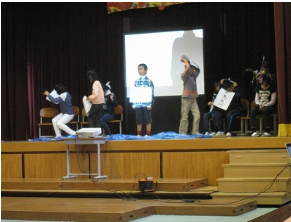
斐伊川の上流・中流・下流を調査しました。クイズや絵で表しました。