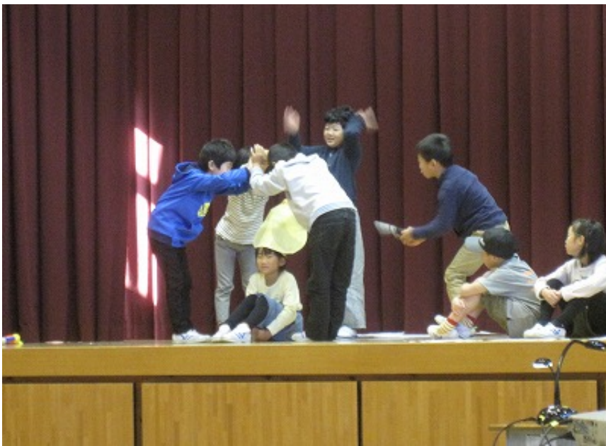
駐在所、公民館、散髪屋さん、ぶどう園などで見聞きしたことを表現しました。