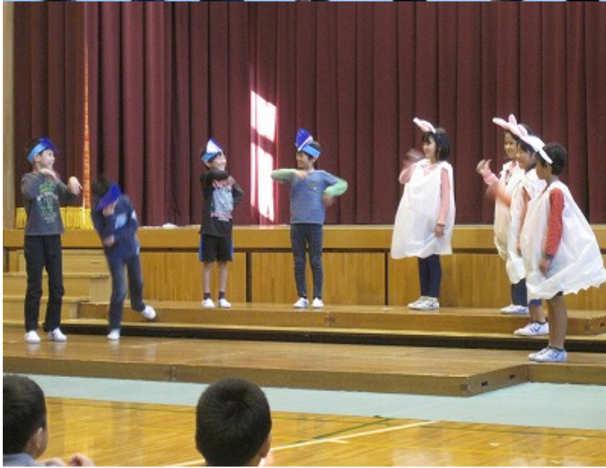
白うさぎとワニザメのくらべこの場面です。