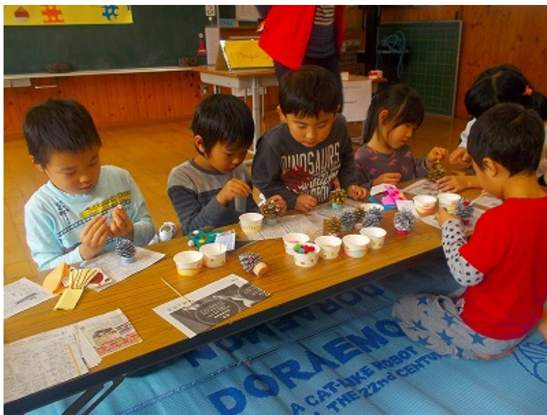
松ぼっくりをがすてきな飾りに変身しました。