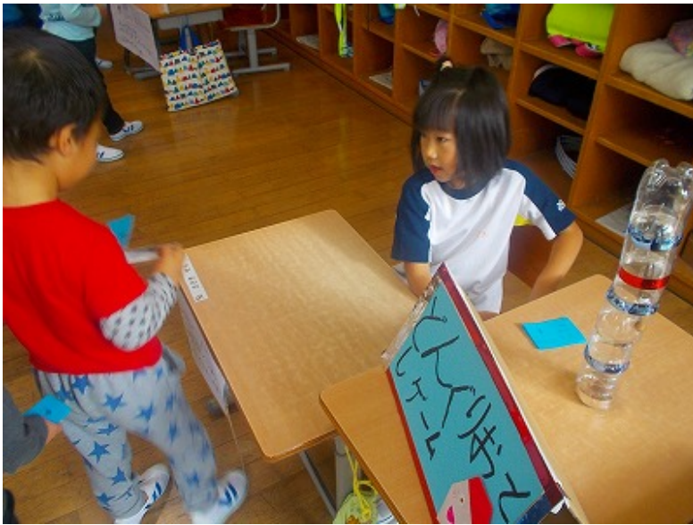
秋に見つけたどんぐりや葉っぱなどを使ってのゲームです。