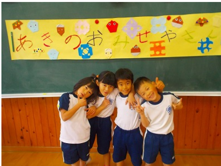
幼稚園の年長さんに喜んでもらいました。終わって笑顔の1年生です。