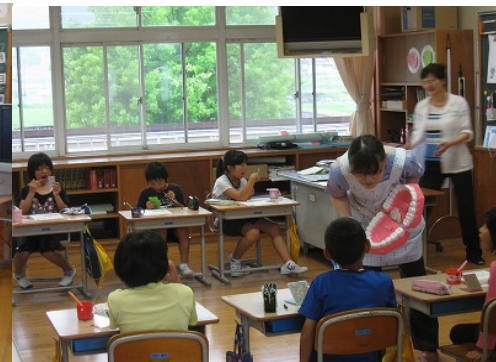
4年生 奥歯の磨き方