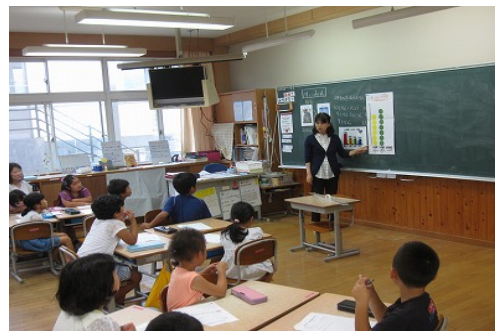
2年生 すいみんのなぞ