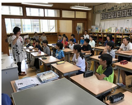
5・6年生 メディアの害と健康