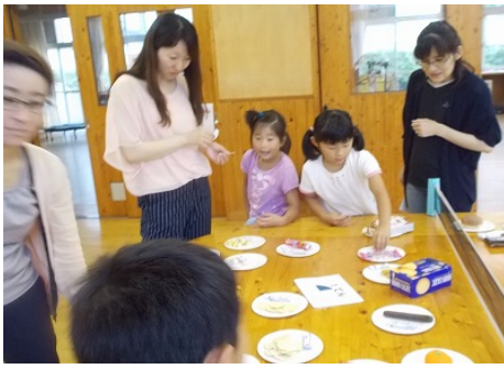
1年生 おやつのと리카た