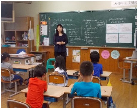
3年生 ゲームとのつきあい方