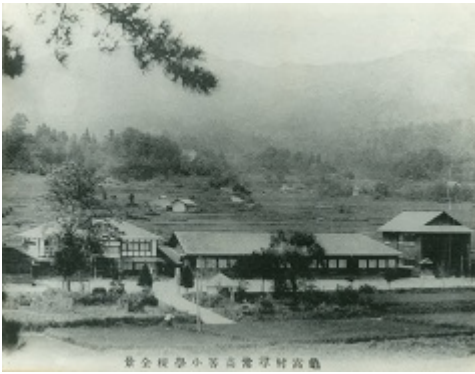
「亀高村尋常高等小学校」写真。明治期だと思われる。