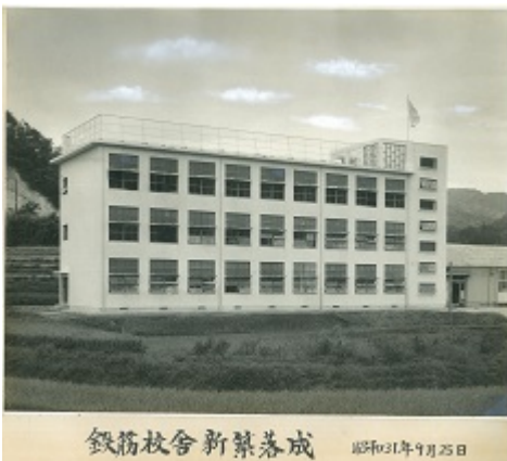
昭和31年「鉄筋校舎新築落成」写真。島根県初の鉄筋校舎。