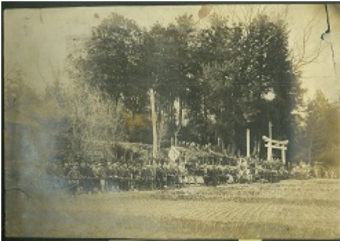
「湯野神社石門建立」大正14年の写真。