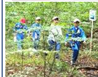
オリエンテーリング