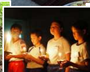
キャンドルの集い