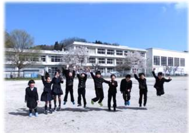
↑3年生「どんときもスマイルでがんばるぞ！」

ここまで大きな混乱もなく生活できており、このやり方がすっかり浸透したと実感しています。鳴らさないことによるデメリットも確かにありますが、それを上回る教育的効果があると信じて、子どもたちの様子を見守りたいと思います。