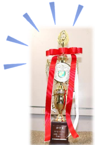
↑学校賞のトロフィー!!