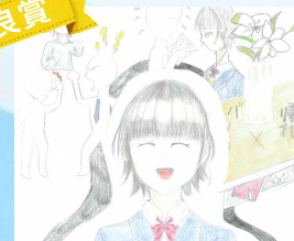
山根 一華 (横田中)