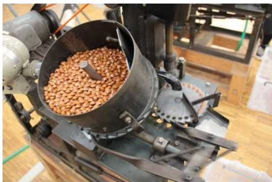
【そろばん製造中の様子です】