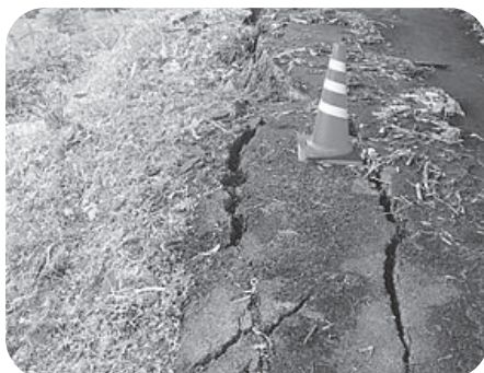
町道の法面の崩壊 三成地区

地域脱炭素移行・再エネ推進交付金重点対策加速化事業 地域脱炭素移行・再エネ推進交付金事業実施に要する経費 3135万円