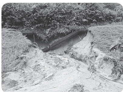
水路の崩壊 亀嵩地区亀嵩地内