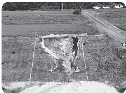
水田法面の崩落 亀嵩地区郡地内