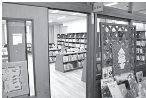
横田小学校図書館

教育長 町では令和7年度から3か年の子ども読書活動推進計画を策定し4つの視点から推進している。 一 幼児期や家庭における子どもの読書活動の推進 二 学校教育における読書活動の推進