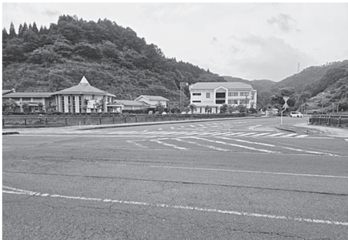
三成市街地ゾーン設定地周辺

面の推進にあたり、まちづくりに関わる様々な関係部局との連携を図り、移住や日常生活に必要な都市機能の誘導を推進するための具体的な進め方は。