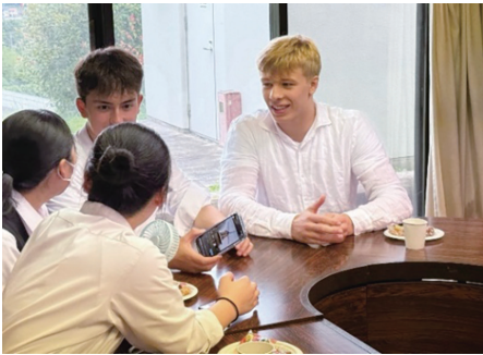
横田高校生との交流の様子

6月28日から7月6日までの滞在期間中は、町内2組のホストファミリーの協力のもとホームステイが行われ、横田高校生との交流会のほか、そろばん体験や安楽寺での座禅体験、森田醤油での醤油づくり見学などを行いました。