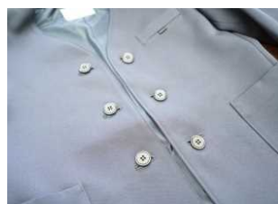
・イートンタイプ