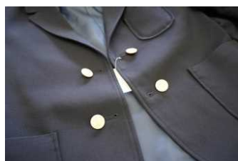
・ブレザータイプ