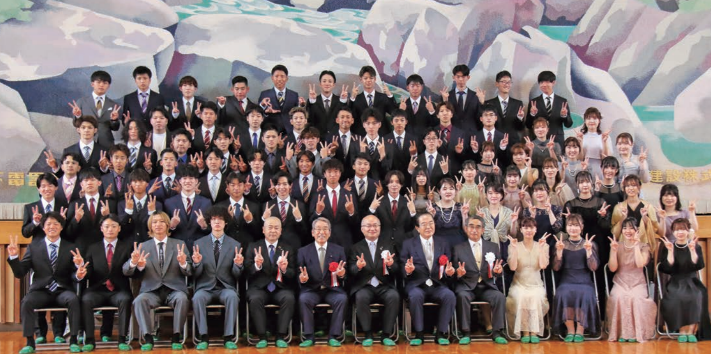
二十歳の抱負、思い、今後の目標、伝えたい気持ちなどを一言書いていただきました。