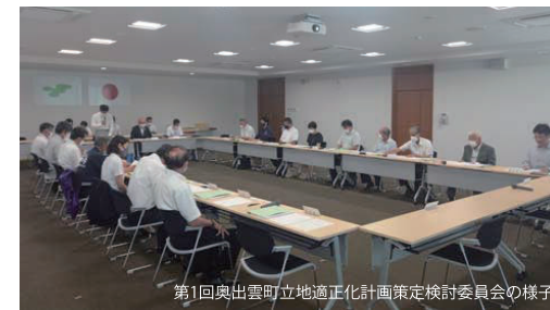
第1回奥出雲町立地適正化計画策定検討委員会の様子

立地適正化計画の策定に向けて、役場内の検討会も立ち上げ、各課横断的に様々な視点から調整や連携を図り、計画づくりを行います。また、町民アンケート調査やヒアリング調査、地域座談会等を実施し、町民の皆様のご意見を踏まえた計画づくりを進めて参ります。