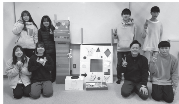
レクリエーション受講生 2年理学・作業療法学科8名

授業「レクリエーション」(自由に選択希望できる科目。在学中にレクリエーションインストラクター資格取得可)の一環で、子どもたちの発達段階に応じたレクリエーション道具「おもちゃ」の製作をしました。おもちゃには「めあて」があり、おもちゃ遊びを通して「順番を守ること」「お友だちと仲良く協力すること」等、就学に必要なスキル獲得を目的に製作しました。作品は三成幼稚園に寄贈させていただきました。