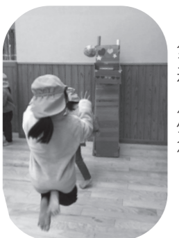
ダンボールバスケット