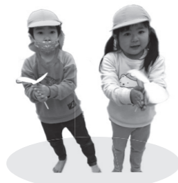
牛乳パック竹とんぼ