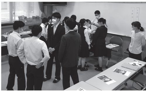
▲制服について考える会の様子

10月の生徒総会で、新旧生徒会役員が交代します。新たに発足する執行部には、先輩達が築いてきた横田高校の伝統を引き継ぎつつ、新しいことに積極的にチャレンジしてほしいと思います。