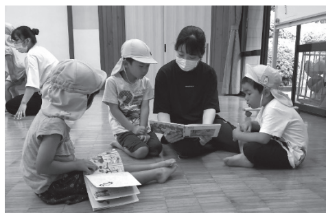
▲読み聞かせをする学生