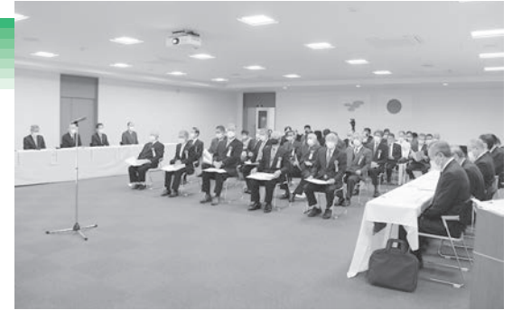
第14回雲南地区交通安全大会の様子

雲南地区交通安全協会と雲南市、飯南町、奥出雲町が主催する雲南地区交通安全大会を11月19日に奥出雲町で開催しました。