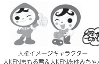
人権イメージキャラクター 人KENまもる君&人KENあゆみちゃん

【相談員】法務局職員又は人権擁護委員 【お問い合わせ】松江地方務局人権擁護課 電話:0852-32-4260 町民課戸籍グループ 有線:31-5106 電話:54-2510