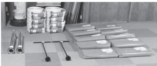
八代町自治会に整備された消火栓ホースやブルーシート等の防災備品

宝くじコミュニティ助成事業の1つである「自主防災組織育成事業」により、八代町自治会に防災備品が整備されました。これまで、消火活動に必要なホースや管鎗等の備品が経年劣化により十分な機能を発揮できない状況でしたが、新たに整備されたことにより、出火時によりスムーズな消火が期待されます。