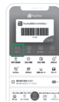
①アプリのホーム画面にある「スキャン」をタップします。