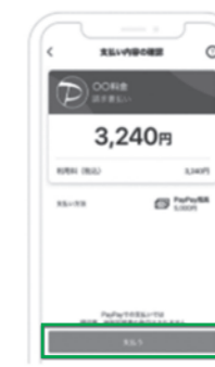
③支払金額を確認し「支払う」をタップします。