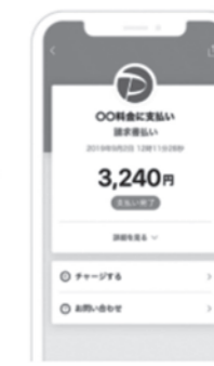
④納付が完了しました。