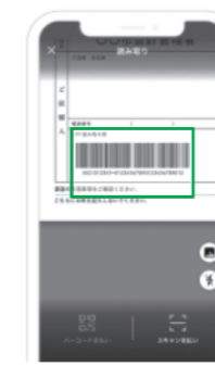
②払込票のバーコードを読み取ります。