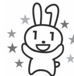
マイナンバーカード PRキャラクター マイナちゃん

1点で確認できるもの ※官公庁が発行したもので、顔写真付きのもの 運転免許証、パスポート、在留カード、身体障害者手帳等 2点必要なもの 健康保険証、介護保険者証、年金手帳、年金証書等