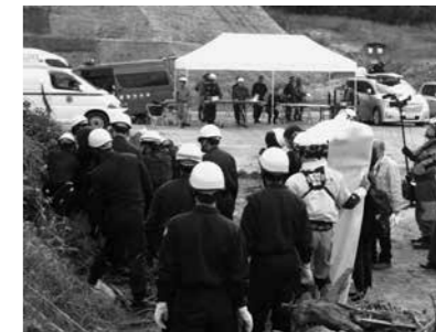
雲南警察署と雲南消防本部は連携しており、毎年、様々な災害等を想定した合同訓練を行い、災害に備えています。

あなたの「お住まいや勤務先は大丈夫ですか？」 土砂崩れや浸水の可能性がある場合は、避難情報（警戒レベル）を確かめ、早めに避難しましょう。