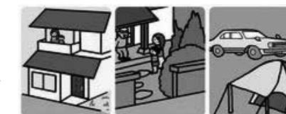
在宅避難 縁故避難 青空避難

「避難」とは「難」を「避ける」ことであり、自宅での安全確保が可能な人は、感染リスクを負ってまで避難所に行く必要はありません。自宅が危険な場合、避難先は町が開設する避難所だけでなく、親戚や友人宅が安全であれば、避難先として検討して下さい。