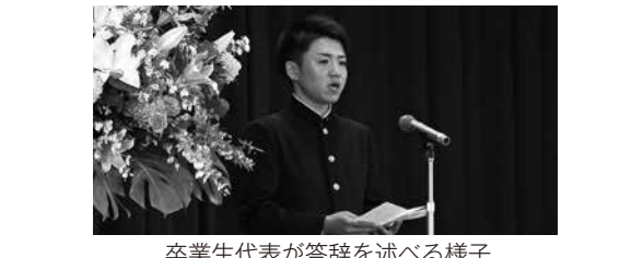
卒業生代表が答辞を述べる様子

3月1日、卒業証書授与式を行いました。コロナウィルス感染防止のため、卒業生、保護者、教職員のみでの参加となりました。今年度は創立百周年という記念すべき年で、卒業生にとって、稲穂祭のフィナーレで生徒会の生徒が企画・実施した100の人文字作りを行ったことや、厳格な式典に参加したこと等が、とても印象深いものとなりました。 卒業生代表は、答辞で「1年生の『奥出雲学』や2年生の『だんだんカンパニー』といった地域課題研究を通して、『何らかの形で地域に貢献したい』『地域を元気にしたい』という気持ちを一人ひとりが自分の中に持っています。たとえ別の場所で暮らすことになっても、この奥出雲の地が私たちの礎を築いた場所であることには変わりありません。この3年間の横田高校での学びを胸に刻み、国際化や情報化が進む困難な時代を乗り越えていきます。」と述べました。