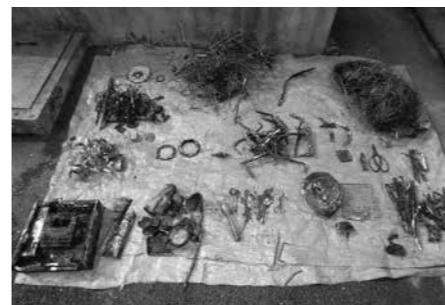
持ち込まれた不燃物

ごみを出す際は、正しく分別していただきますよう、皆様のご理解とご協力をお願いします。