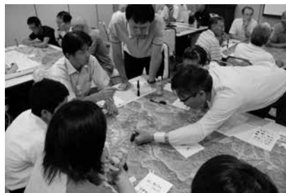
「三成郷づくりの会」の話し合いの様子