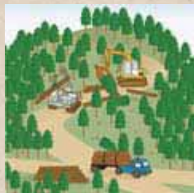
適切に森林整備を推進！