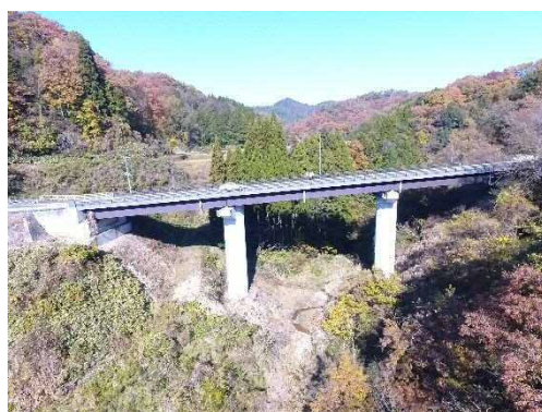
写真 5-1 ドローン点検活用橋梁 (左: 西尾大橋、右: 山方大橋)