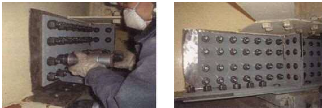
写真4-1 当て板工実施状況

激しい腐食による鋼部材の減厚が生じた箇所に対し、腐食箇所を取り囲むように当て板（添接版）を施すことにより鋼部材を補修する工法である。