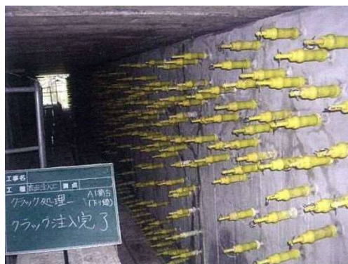
写真 4-2 ひび割れ注入状況

ひび割れを塞ぐことにより、劣化因子（水分、塩化物など）の侵入を防止し、コンクリートの耐久性を向上することができる。