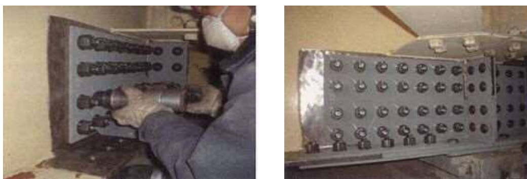
写真 4-1 当て板工実施状況

激しい腐食による鋼部材の減厚が生じた箇所に対し、腐食箇所を取り囲むようにあて板（添接版）を施すことにより鋼部材を補修する工法である。