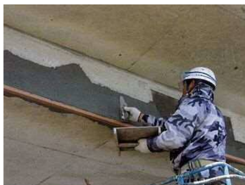
写真 4-3 断面修復状況