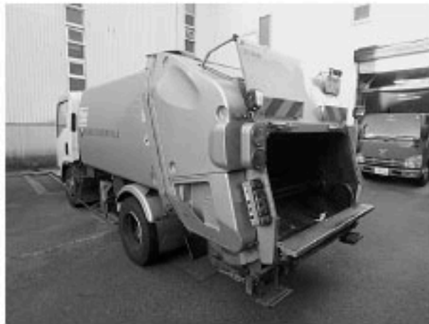
取得されるゴミ収集車