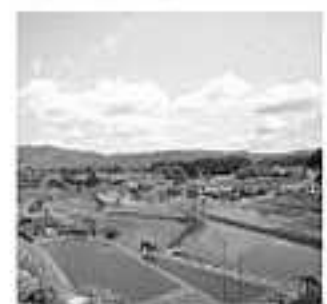
奥出雲たたら製鉄および榎田