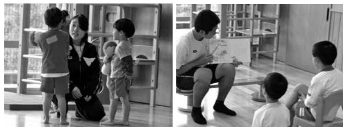
▲子どもの目線にあわせ会話をしたり、本を読み聞かせたりしました

乳幼児とふれあう学習をとおして、乳幼児の生活・成長と発達課題・かかわり方について学ぶことを目的に、9月、11月に保育実習を2回実施しました。1回目では、幼児たちとのコミュニケーションの取り方について学びました。さらに2回目では、幼児たちの安全や成長などについて細かい気配りをしながらの実習を行いました。