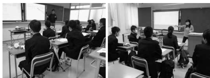
▲入試対策に向け集中して解説を聞く受験生たち

12月26、27日に横田高校で仁多中学校、横田中学校の生徒を対象に、英語・数学の2教科で高校入試で出題される内容についての講座を行いました。参加した中学生から「とても分かりやすかった」「しっかりと基礎を学べたので、これからの入試勉強に活かしたい」等の感想が寄せられました。