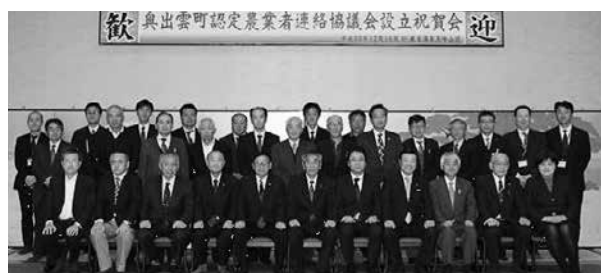
▲奥出雲町認定農業者連絡協議会設立総会の様子

地域農業の担い手である認定農業者が連携し、相互研鑽と情報の交換・共有を図り、経営基盤の安定と本町の農業の発展に寄与することを目的に、12月18日、奥出雲町認定農業者連絡協議会が設立されました。