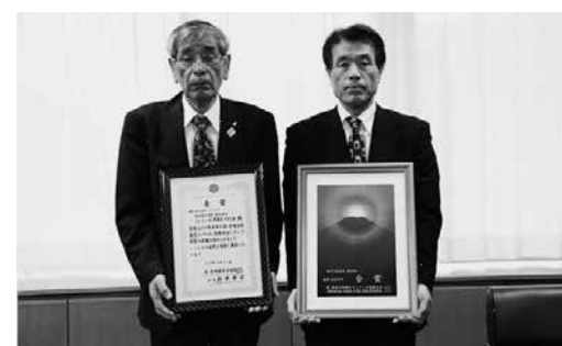
▲勝田町長と奥出雲仁多米(株)内田管理部長(右)

食味の優れたお米を選ぶ第20回米・食味分析鑑定コンクール国際大会が11月26日、27日に岐阜県高山市で開催されました。