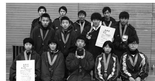
▲3位に入賞した奥出雲チームの皆さん

12月9日、第27回浜田-益田間駅伝競走大会(しおかぜ駅伝)が開催され、県内から38チームが参加し、優勝を目指しました。