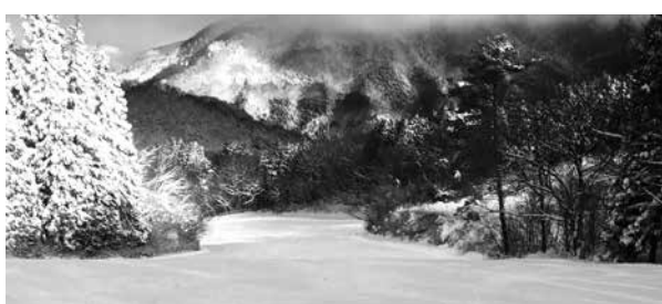
▲12月29日の午後からオープンしたスキー場

12月23日、三井野原スキー場のスキー場開きが行われ、関係者がシーズン中の安全と盛況を祈願しました。また、積雪が無かったことから降雪祈願も行われました。