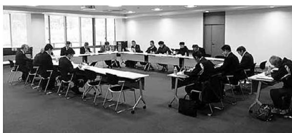
▲奥出雲町畜産クラスター協議会設立総会の様子

12月17日、奥出雲町畜産クラスター協議会の設立総会が役場仁多庁舎で開催されました。