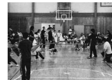
▲応援が響きわたる綱引き

7月1日、「半夏の運動会」として地域に親しまれている八川地区民体育大会が開催されました。