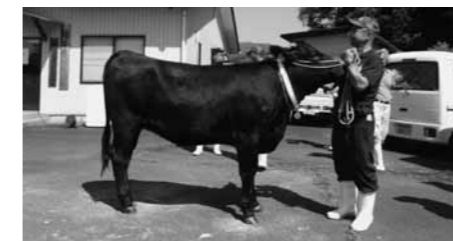
▲特選賞首席「りぼん」号

9月26日に、平成29年度奥出雲町肉用種牛共進会が、仁多中央家畜集合所において開催され、町内の畜産関係者など約150人が集まりました。