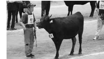
▲審査中の「ゆりか」号

和牛のオリンピックと呼ばれる、全国和牛能力共進会が9月7日から11日まで、宮城県仙台市を会場に開催されました。