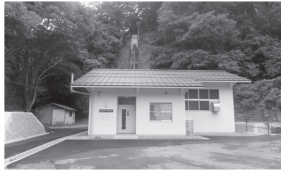
■仁多発電事業特別会計 仁多発電所改築事業……………2億5,655万円