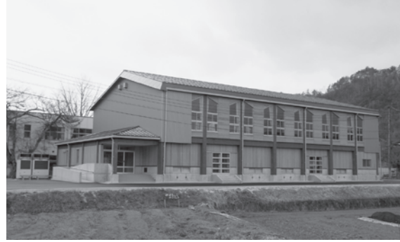
■一般会計 八川小学校屋内運動場建築事業……………2億7,524万円