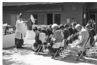
シーズン中の安全を祈願