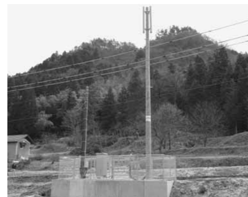
加食基地局の鉄塔

利用できる携帯電話事業者は、河内局がNTTドコモ、加食局がKDDI（AU）の各社です。