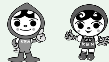
人権イメージキャラクター 人KEN まる君 & 人KEN あゆみちゃん

お問い合わせ ： 役場町民課町民グループ 電話54-2510 有線31-5105