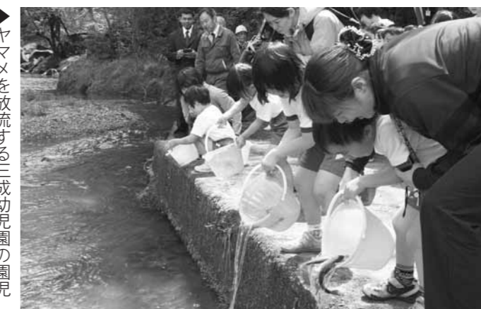
▶ヤマメを放流する三成幼稚園の園児

安全祈願祭の後には、玉日女橋付近の川辺で25名の三成幼稚園園児が、ヤマメを放流しました。園児たちは放流したヤマメが泳ぐ姿を見て歓声を上げて喜んでいました。鬼の舌震は年間を通じて多くの観光客が訪れ、四季折々の雄大な風景を楽しめます。この日も多くの観光客が新緑の渓谷や吊橋からの眺めを楽しみ姿が見られました。