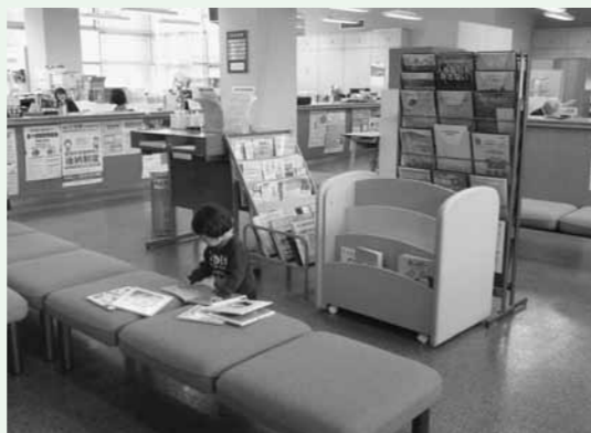
▲税務課窓口前の様子

安心して子育てができる環境の整備を目的に、ベンチとマットを置いたキッズスペースを横田庁舎子育て支援課横に設置しました。併せて、書架に絵本等も配置し、お子様と一緒に訪れやすい環境となりました。ぜひご利用ください。