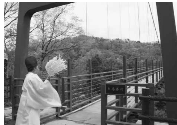
▲川開き安全祈願祭の様子

名勝天然記念物「鬼の舌震」の川開き安全祈願祭が4月22日、「舌震の恋」吊橋前でられました。地元団体、観光文化協会などの関係者約30名が出席し、観光シーズン中の安全と観光振興を祈願しました。