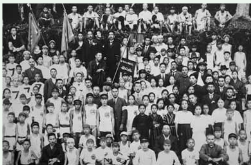
大正時代の集合写真

郡陸に関する過去の資料等(昔の写真、賞状など)をお持ちの方は、6月末までに町体協事務局(52-2680)までご連絡願います。また、お持ちの資料の貸出についてもご協力願います。