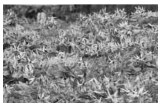
4月24日撮影のカタクリ

この日は、天候の影響で開花したカタクリの群生を見ることはできませんでしたが、頂上では横田山の会によるカタクリの生態を紹介する紙芝居があり、登山者は興味深そうに耳を傾けていました。