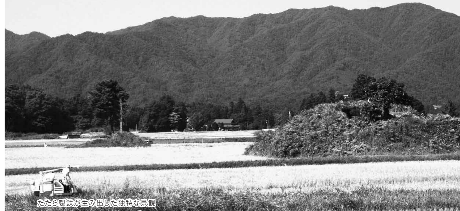
たたら製鉄が生み出した独特な景観