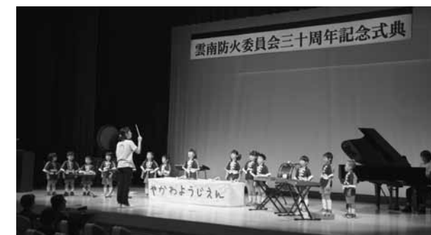
八川幼稚園幼年消防クラブのかわいい演奏

一般財団法人自治総合センターが、宝くじの社会貢献広報事業として行うもので、コミュニティ活動に必要な備品や集会施設の整備等に対して助成を行い、地域のコミュニティ活動の充実・強化を図ることにより、地域社会の健全な発展と住民福祉の向上に寄与するための事業です。