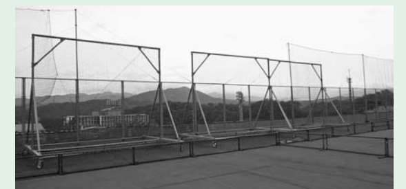
▲整備された防球フェンスネット

平成26年度は、三成公園ホッケー場で使用する防球フェンスネットなどを整備しました。小学生から社会人まで日々の練習や各種大会で使用され、ホッケー競技の振興が期待されます。