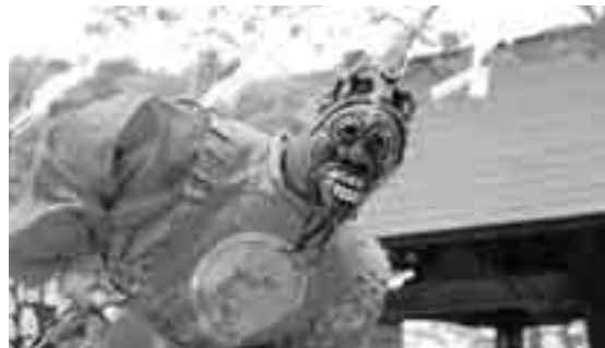
▲「蓮華会舞」重要無形民俗文化財