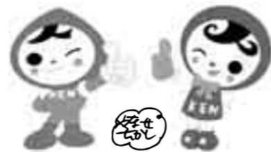
人権イメージキャラクター 人KENまる君 & 人KENあゆみちゃん