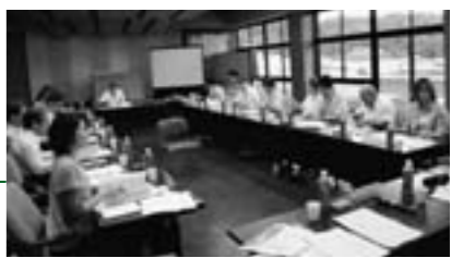
▲第1回地域公共交通会議の様子

洗い出された現状の問題点・課題を踏まえ、解決策と将来にわたって持続可能な奥出雲町の公共交通のあり方を『奥出雲町地域交通計画』としてまとめます。