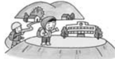
避難所、避難路の確認