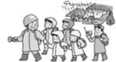
声を掛け合って早めの避難

※がけ地や溪流の異常を発見した場合は、速やかに役場や仁多土木事業所へご相談ください