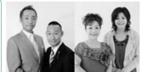
シンデレラエクスプレス 海原さおり・しおり

日時 平成24年7月13日(金) 開場:午後6時 開演:午後6時30分(終演予定:午後8時) 会場 奥出雲町立町民体育館 出演 1本目:暁照夫・光夫、シンデレラエクスプレス 2本目:横山たかし・ひろし、海原さおり・しおり 司会:比留木剛史アナウンサー