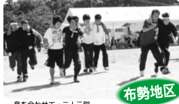
息を合わせて・二人三脚

秋晴れが続いた3連休最終日の9月25日、布勢、三成、亀嵩、阿井、三沢地区で地区民体育大会が開催されました。各地区では、子どもから大人まで多くの人が会場に足を運び、競技や応援に心地よい汗を流しました。また、競技の合間やお昼休みには、応援合戦や趣向を凝らしたアトラクションが行われ、会場を盛り上げていました。