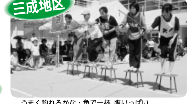
うまく釣れるかな・魚で一杯、腹いっぱい