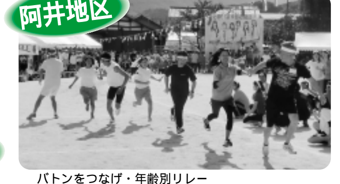
バトンをつなげ・年齢別リレー