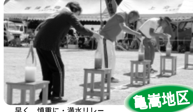
早く、慎重に・滴水リレー