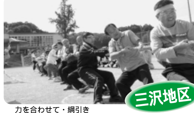
力を合わせて・綱引き